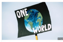
Umfrage zum Thema Klimaschutz Wie wichtig ist für Sie das Thema Klimaschutz und Klimafolgenanpassung? Welche Themen haben Sie für wichtig und was wünschen Sie sich zukünftig in diesem Zusammenhang von Politik und Verwaltung?