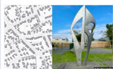
Standortsuche für die Skulptur des Künstlers Herbert Lorenz Für die Skulptur des Künstlers Herbert Lorenz wird ein neuer Standort gesucht.

Auf der Iserlohner Beteiligungsplattform http://beteiligung.iserlohn.de wurden im Herbst 2021 zwei weitere Beteiligungen durchgeführt. So wurde anhand eines Kartendialogs ein neuer Standort für eine Skulptur in Hennen gesucht. Außerdem fand eine Umfrage zum Thema „Klimaschutz und Klimafolgenanpassung“ statt. Die Ergebnisse lassen sich auf der Plattform einsehen. Aktuell läuft eine weitere Online-Beteiligung zur Namensfindung für die Stadtspange West in Letmathe.